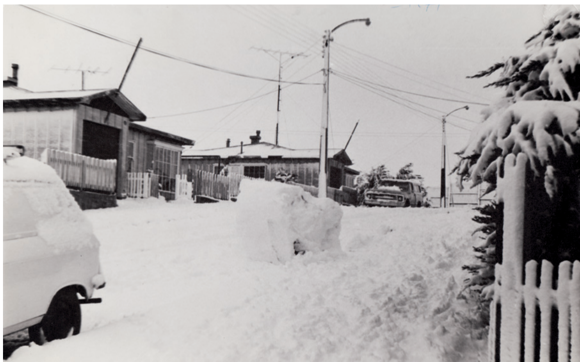
Figura 4. Viviendas del campamento Manantiales, primera población enapina en Tierra del Fuego (Fotografía: Gallardo, P. 1968).

Vista aérea da planta Manantiales, a primeira refinaria de petróleo do país, instalada em Tierra del Fuego (Fotografía: Gallardo, P. 1968).