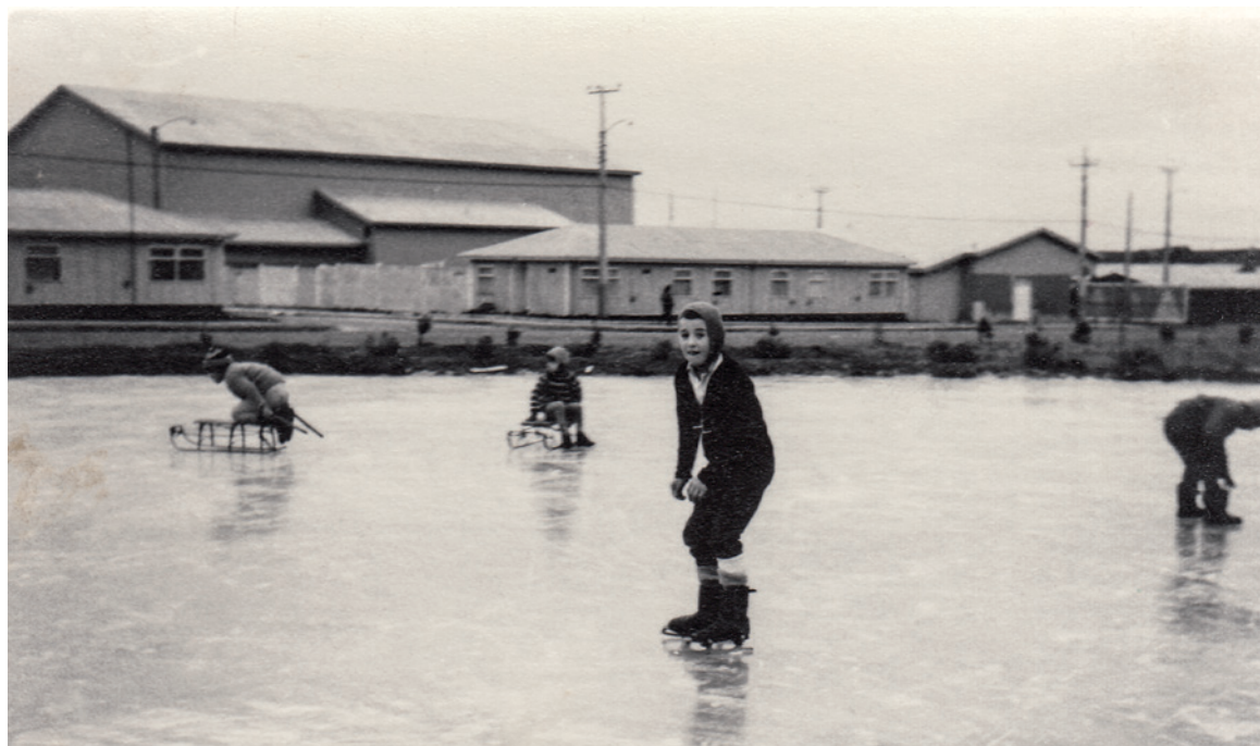
Figura 5. Laguna congelada en campamento Cullen, utilizada por los niños enapinos para practicar patinaje en hielo.

Frozen pond at Cullen camp, used by enapinos children to practice ice skating.