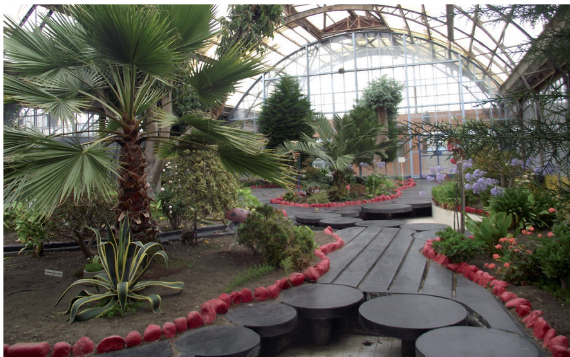
Figura 2. Jardín interior conocido como "solárium", excampamento enapino, Cerro Sombrero (Fotografía: Acevedo, P. 2015). Indoor garden known as "solarium", former enapino camp, Cerro Sombrero. (Photograph: Acevedo, P. 2015). Jardim interior conhecido como "solário", ex-povoado enapino, Cerro Sombrero (Fotografia: Acevedo, P. 2015).

Así, resulta necesario destacar que en primer lugar se levantó Manantiales (1949), lugar donde se descubrió petróleo de características comerciales y donde se construyó la primera planta refinadora de hidrocarburos del país. Con posterioridad, luego de la puesta en operación de más de una treintena de pozos en este sector (Martinic 2013), se construyó la primera población que estuvo dotada de gimnasio, escuela, casas y un policlínico para atender a los trabajadores (Figuras 3 y 4). A nivel tecnológico, Manantiales fue fundamental, en especial en la primera etapa de la producción petrolera en la isla,