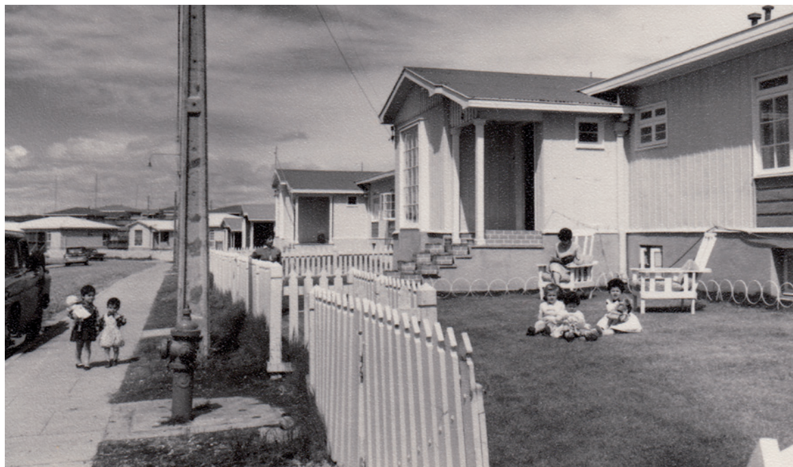
Figura 6. Vida familiar en el campamento de Cerro Sombrero (Fotografía: Gallardo, P. 1965).

Lago congelado em povoado Cullen, usado por crianças enapinas para a pratica de patinação no gelo (Fotografia: Tafra, D. 1966).