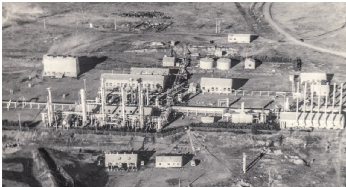
Figura 3. Vista aérea planta Manantiales, la primera refinera de petróleo del país, instalada en Tierra del Fuego.

Aerial view of Manantiales plant, the country's first oil refinery, installed in Tierra del Fuego.