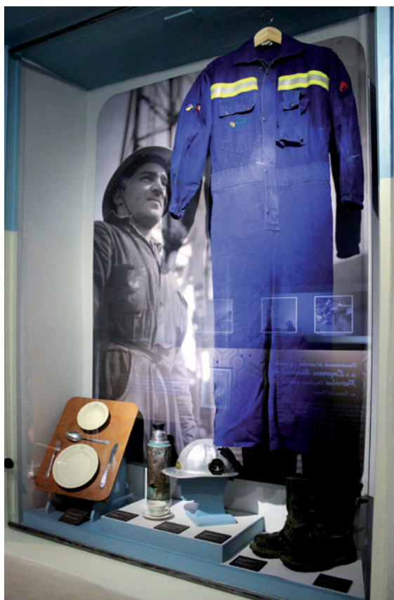
Figura 9. Indumentaria utilizada por los trabajadores de la ENAP durante las faenas en la pampa fueguina. Clothing used by ENAP employees during the work in the pampa fueguina. Vestuário usado por trabalhadores da ENAP durante o trabalho na pampa fueguina.