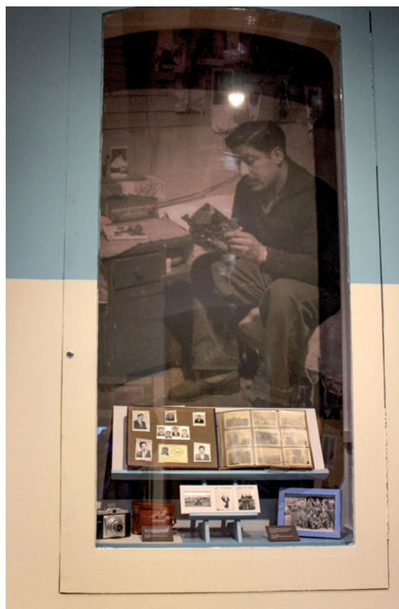
Figura 10. Vitrina dedicada a los recuerdos cotidianos de las familias enapinas, los que quedaron plasmados en álbumes de fotografía que atesoran hasta hoy. Showcase dedicated to the daily memories of enapinas families, captured in photo albums that they treasure to this day. Vitrine dedicada às memórias cotidianas das famílias enapinas, capturadas e preservadas em álbuns de fotos até hoje.

parte las navidades, las premiaciones escolares y las colonias de verano destinadas a los hijos e hijas de los trabajadores petroleros.