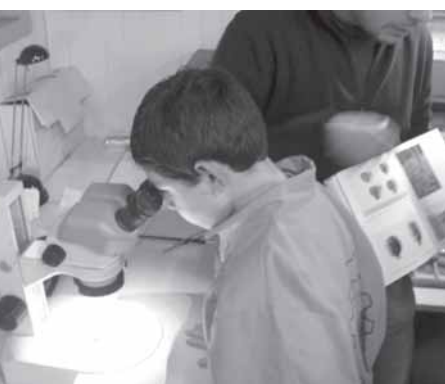
Foto 8: Observando con lupa, la idea del taller es que los niños vivan la experiencia de la prehistoria a través de la observación, experimentación y replicación de artefactos.

en las épocas del contacto español-indígena, el proceso de colonización alemana y la sociedad contemporánea en el sur de Chile y actual X Región.