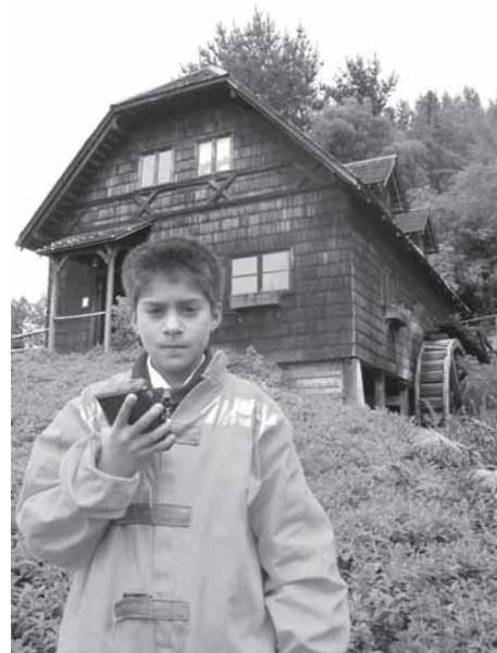
Foto 6: Museonauta, traje utilizado por los niños para realizar su viaje en el tiempo.