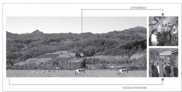
Foto 3: Ubicación del sitio Alero Marifilo-1 en la comuna de Panguipulli, Prov. de Valdivia, donde se realizó un taller de educación en la propia excavación.

Sitio Alero Marifilo-1 Comunidad de Pucura, Comuna de Panguipulli, X Región