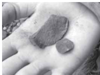
Foto 7: Haciendo lascas, los niños experimentan las antiguas prácticas tecnológicas construyendo puntas de flecha, cántaros o cordeles con fibras vegetales.