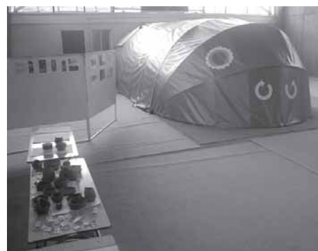
Foto 5: El proyecto Máquina del Tiempo es un taller interactivo, donde el contenido arqueológico y patrimonial es mostrado a través de una instalación que incluye: taller práctico, audiovisuales, paneles y réplicas arqueológicas.

Considerando los planteamientos cognoscitivo-constructivistas acerca de la necesaria pertinencia de los contenidos y la acción de los “filtros culturales” en todo proceso de aprendizaje, se planteó la conveniencia de utilizar referentes culturales locales para contextualizar la evolución de la tecnología y la cultura y sus procesos de retroalimentación mutua. Se utilizó el conocimiento generado en las investigaciones desarrolladas en los sitios arqueológicos de Monte Verde y Pitrén —fundamentales para el entendimiento de la prehistoria de la décima región—, y la utilización de los antecedentes históricos, etnográficos y etnohistóricos que dan cuenta de las diversas expresiones tecnológicas desarrolladas