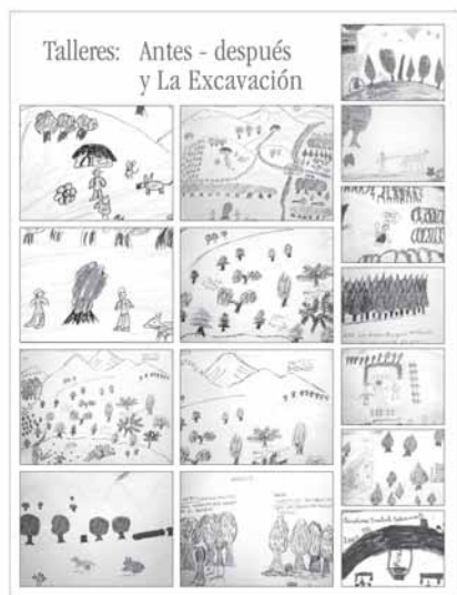
Foto 4: Dibujos realizados por los niños de la Esc. N° 65 de Pucura. Los dibujos muestran cómo los niños interpretan el pasado y el presente y cómo ven la excavación arqueológica.