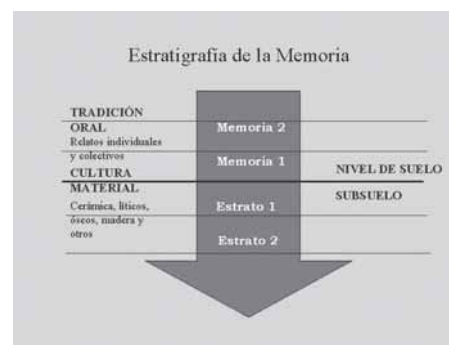
Foto 2: Diagrama que muestra la metodología utilizada en el taller, se reconstruye la historia local con la lógica del trabajo arqueológico, levantando y sistematizando diversas capas de memoria colectiva y cultura material.

La habilitación de la Sala Multimedia de Educación Patrimonial y la creación del sitio web si bien no soluciona completamente el problema de democratizar el acceso a los recursos patrimoniales y su esperada puesta en valor, contribuye a mejorar nuestro trabajo en Educación Patrimonial, permitiendo tanto