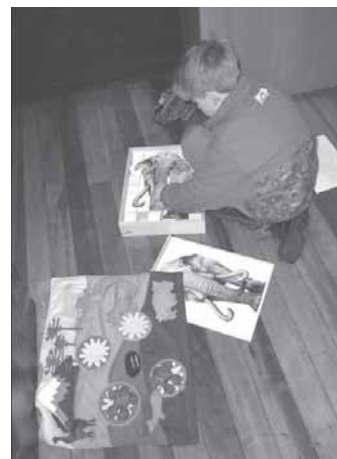
Foto 9: La idea de este proyecto es mostrar la prehistoria de la zona centro sur desde una perspectiva global, en la que niños y adultos interactúen con la museografía a través de juegos, paisaje sonoro y textos-guías

Concurso de Pintura: Una vez realizado el recorrido por parte de los alumnos, se les invita a participar en un concurso de pintura en el que puedan plasmar sus impresiones sobre la prehistoria regional, a partir de lo visto y experimentado en la muestra.