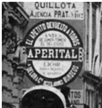
Foto 2. Ampliación de imagen de tono continuo. La Cruz de Reyes. Album Fotográfico "Vistas de Valparaíso" de Felix Leblanc. C. 1890. Colección Sala Medina Biblioteca Nacional. Presenta mayor cantidad de información recuperable.

La condición de tono continuo o de trama de un determinado material nos presenta un primer problema para resolver desde el punto de vista de la captura digital, el que se traduce en la estrategia a utilizar para registrar la mayor cantidad de información relevante del material análogo disponible. Las imágenes de tono continuo, al no estar compuestas por una matriz de punto, presentan una mayor cantidad de información recuperable al ser digitalizadas que las imágenes de trama, por esta razón, aumentar la resolución o frecuencia de captura en este tipo de materiales nos permitirá obtener una mayor información del original. Por el contrario, la digitalización en una resolución alta de materiales de trama no nos permitirá obtener mayor información que la existente en la matriz de punto y nos producirá documentos electrónicos de gran tamaño de archivo, aumentando la problemática existente en los procesos de almacenamiento y respaldo de la información digital.