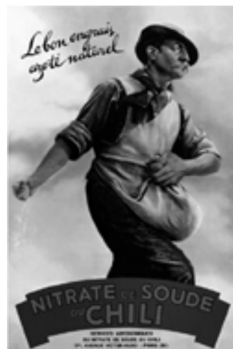
Imagen digitalizada con calidad de publicación en web.