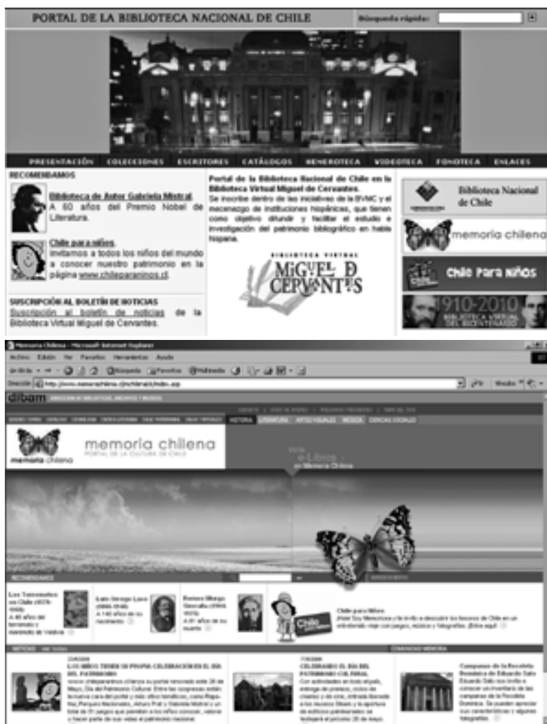
Portal de contenidos culturales Memoria Chilena. Proyecto de digitalización iniciado el año 2000. Al año 2006, más de 700.000 imágenes digitalizadas.

Sin embargo, ésta no es una tarea sencilla, pues es necesario considerar varios aspectos como el estado físico y legal de la información a digitalizar, la comunidad y el uso a la que está dirigida, el tipo de formato analógico en que se encuentra (audio, video, microfilm, papel, etc.), además de otros factores propios de la conversión