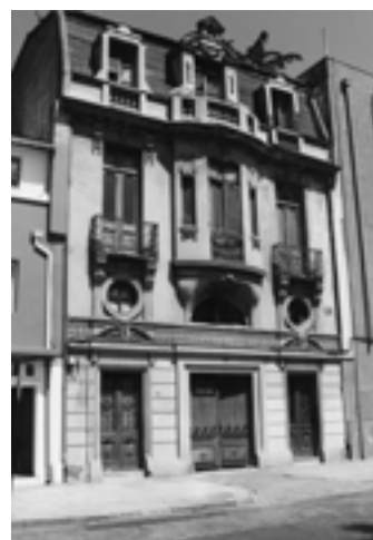
Foto 4. Biblioteca Luis Montt, acceso calle San Ignacio. Fotografía en color. 2003. Fotografía digitalizada para ser publicada en artículo, eliminando posteriormente el archivo digital.