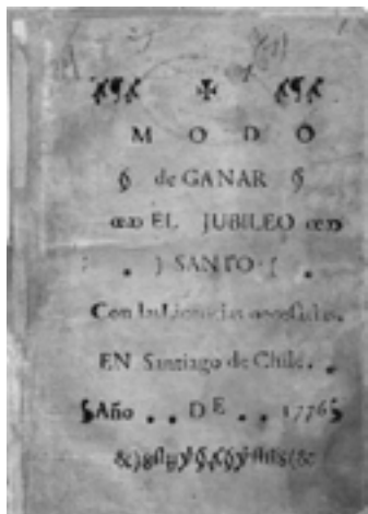
Foto 5. Modo de Ganar el Jubileo Santo. Primer impreso chileno. 1776. Colección Biblioteca Nacional. Por su alto valor patrimonial, la obra fue digitalizada para la elaboración de copia de respaldo master.