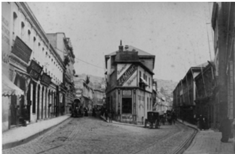
Foto 3. La Cruz de Reyes. Copia de papel albuminado. Album Fotográfico "Vistas de Valparaíso" de Felix Leblanc. C.1890. Colección Sala Medina Biblioteca Nacional. Fotografía digitalizada para copia de respaldo master.

Catálogo automatizado o web: resolución de 150 dpi con dimensión espacial de 750 x 550 píxeles en formato JPEG (Formato de protocolo estándar de compresión por interpolación) en color, escala de grises o bitonal según sean las necesidades de cada caso.