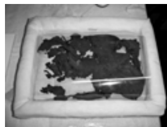
Foto 19. Bolsa acondicionada en su bandeja, 2005.