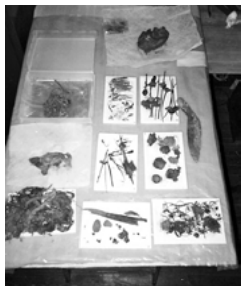
Foto 2. Material desplegado en bandejas, 2005.

En esta etapa también se definen y adquieren los insumos necesarios y se preparan bandejas provisorias de cartones libres de ácido para colocar los materiales a medida que son retirados de la olla.