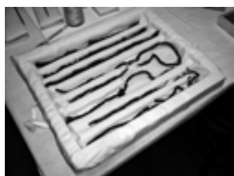
Foto 14. Cuerdas en su soporte, 2005.