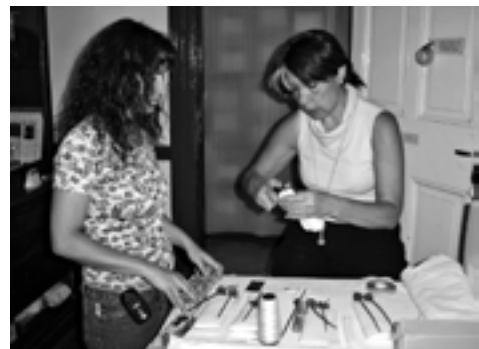
Foto 17. Confección de soportes, 2005.