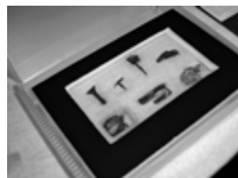
Foto 11. Metales acondicionados, 2006.