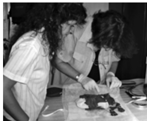
Foto 4. El equipo durante el examen diagnóstico y análisis de la bolsa, 2005.

La estructura general de la olla es estable con una superficie activa del 95%. Presenta un área colapsada de 6 cm de diámetro desplazada hacia fuera, por lo que