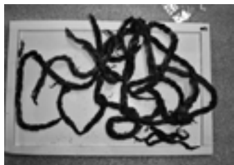
Foto 13. Cuerdas antes de la estabilización, 2005.