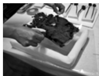
Foto 18. Bolsa en bandeja de Mylar para evitar la manipulación directa, 2005.