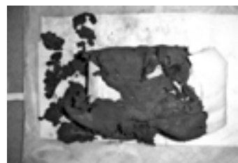
Foto 8. Bolsa de textil en proceso de conservación, 2005.

En el caso de la bolsa tejida de mayor tamaño, su extrema rigidez comprometía la estructura textil y hacía difícil manipularla para apreciar su forma original. Por