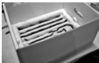
Foto 15. Caja general de los materiales acondicionados, 2005.