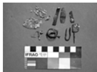
Foto 10. Metales limpios, 2006.