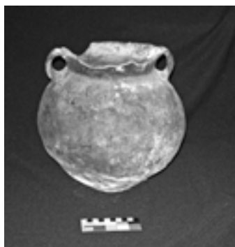
Foto 7. Anverso de la olla, 2006.

De los siete fragmentos hechos de sogas en fibra vegetal torsionada, uno presenta dos nudos simples. El hilado se realizó por la torsión en S de dos elementos dobles torcidos primeramente en Z .