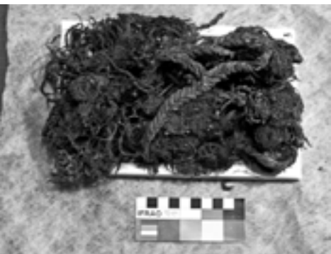
Foto 3. Detalle inicial del material mezclado, 2005.