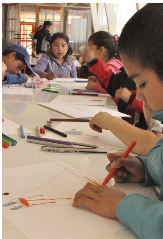
Figura 3. Sesión de taller con escolares en la localidad de Cerro Castillo, en el marco del proyecto “Diagnóstico del paisaje del río Ibáñez”. Workshop session with school children in the village of Cerro Castillo, in the framework of the project “Diagnostic of the Ibáñez River Landscape”.

En la fase anterior, las personas pudieron haber expresado procesos de deterioro o situaciones de conflicto en su relación con el patrimonio o con el paisaje que implican cambios, en desmedro de las valoraciones patrimoniales por ellos enunciadas.