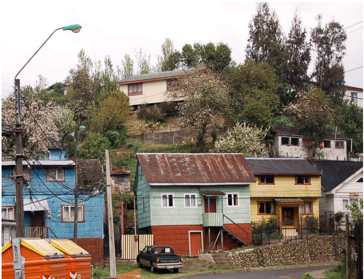
Figura 4. Barrio Puerto de la ciudad de Puerto Montt. Port District in the city of Puerto Montt.

Puerto) y Villa Alemana (barrio Norte), surge una metodología que contiene las fases antes señaladas para sistematizar los procesos de declaratoria y gestión patrimonial. La implementación en estos dos casos de estudio –muy distintos entre sí– nos impele a buscar caminos alternativos que hagan viable su aplicación frente a escenarios diversos, sin perder su objetivo principal. La disponibilidad de recursos y de información puede variar, ostensiblemente, entre una localidad rural y una metrópoli. Hay que simplificar los procesos, apoyarse siempre en los expertos locales y buscar fuentes alternativas de información, en los casos en que sea inviable conseguir antecedentes de fuentes institucionales (Figura 4).