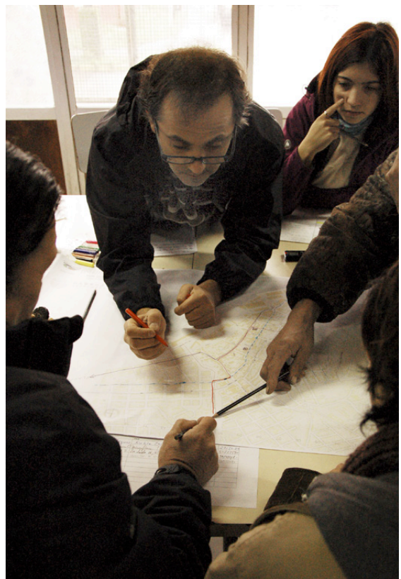
Figura 2. Actividad en el taller de cartografía participativa en el barrio Puerto de la ciudad de Puerto Montt. Activity carried out during the participatory cartography workshop, in Port district, city of Puerto Montt.

La fase metodológica de valoración intenta dilucidar, apoyándose en la etapa previa de establecimiento del carácter, el entramado de valoraciones que coexisten y que dan cuenta de las percepciones de los distintos grupos que conforman una comunidad, de sus puntos de vista y de sus variados intereses. En esta fase es importante comprender cuáles y cómo son los atributos valorados de aquellas huellas que representan los procesos territoriales y que se desean preservar a futuro, así como también los conflictos subyacentes a percepciones y expectativas divergentes (Ladrón de Guevara y Elizaga 2009).