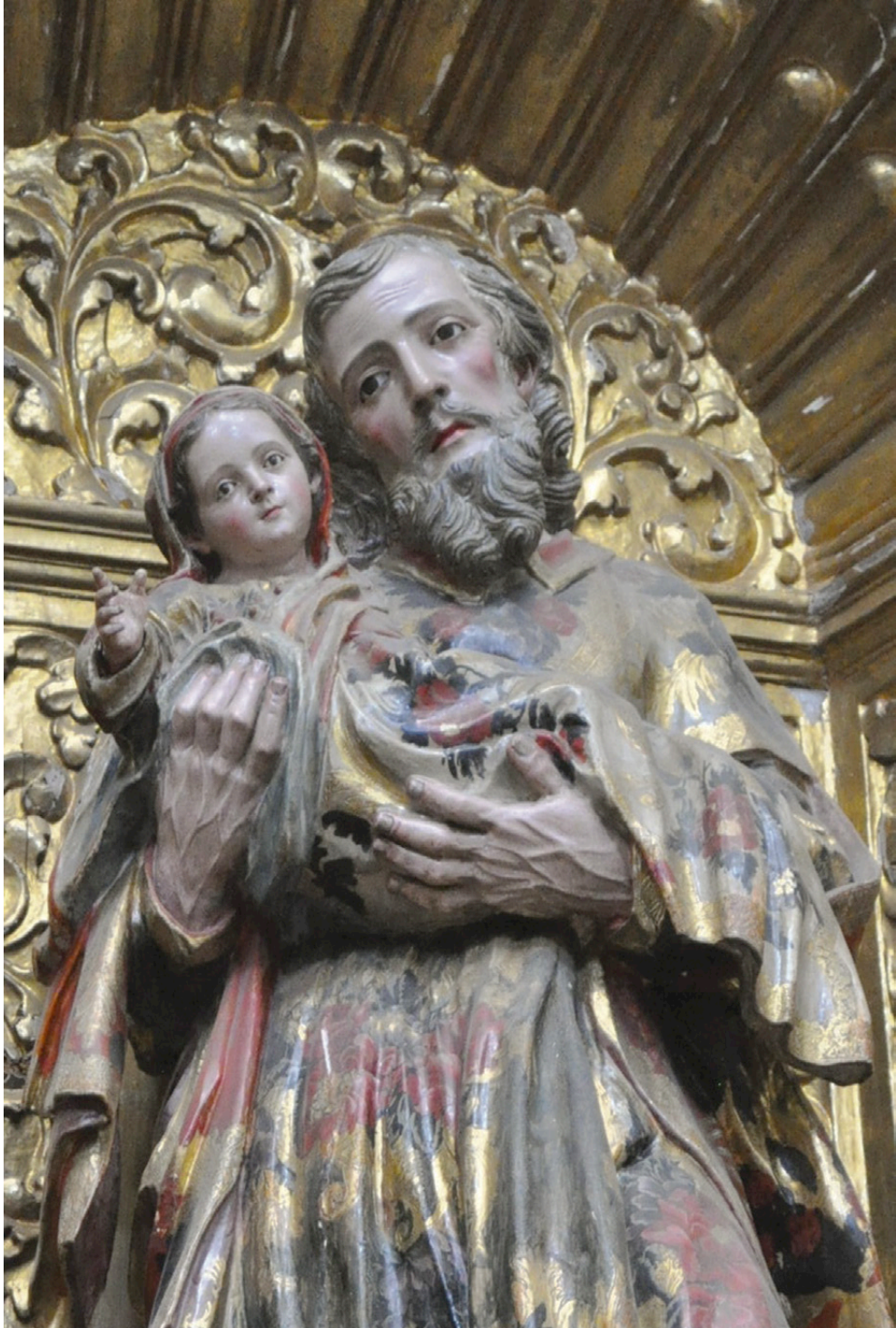
Figura 6. Encarnación mate. Retablo lateral templo de la Soledad, Puebla, México. Mate finish incarnation. Lateral altarpiece from De la Soledad Temple, Puebla, México.