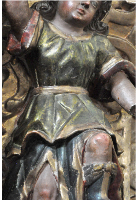
Figura 5. Corladuras en el retablo principal del templo de Santo Domingo, Puebla, México. Corladuras on the main altarpiece from the Santo Domingo Temple, Puebla, México.

Colores lisos o tonos planos: Se utilizaron para colorear elementos como túnicas, mantos, cendales o enseses de las esculturas. Se aplicaban de manera directa sobre el aparejo sellado con gíscola, aun cuando hay casos donde aparecen sobre la hoja metálica. Se trata de tonos densos, mates y opacos. El medio pictórico podía ser una emulsión de temple de huevo, con algún aceite o barniz y pigmentos molidos, o bien aplicando pintura al óleo, con diversos efectos de luces y sombras en los pliegues de los paños (Arrazola 1991: 60).