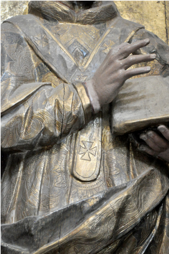
Figura 4. Aplicación de la técnica de cincelado sobre oro bruñido. Talla del retablo lateral de la iglesia de Acatzingo, Puebla, México. Application of the technique of chiseling on burnished gold. Wood carving from the lateral altarpiece from the Acatzingo Church, Puebla, México.

la pieza, con una brocha blanda se les dará una mano de orines (...) [sic].