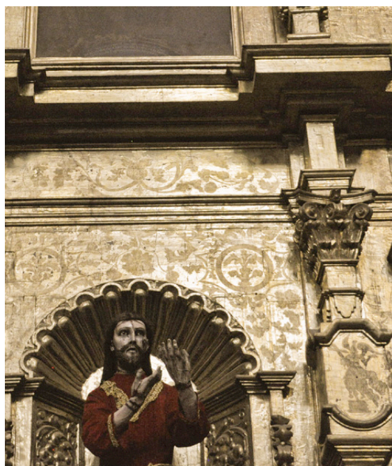
Figura 7. Decoraciones que fusionan oro brillante y oro mate. Retablo del clero secular, parroquia de San Francisco Tepeyanco, Tlaxcala, México. Decorations that fuse shiny and mate gold. Altarpiece from the secular clergy, San Francisco Tepeyanco Parish, Tlaxcala, México.

Debido a la sutileza de elaboración que tiene esta técnica puede pasar inadvertida con facilidad y confundirse con un deterioro por abrasión, o incluso, con una mala factura. Ejemplo de ello es lo observado en el retablo mayor de la parroquia de Otzolotepec, donde en alguna intervención anterior de restauración se “resanaron” con fragmentos de oro los espacios que parecían un faltante por abrasión. Es decir, se intervino sobre el efecto marmoleado original que el maestro policromador le confirió a la superficie.