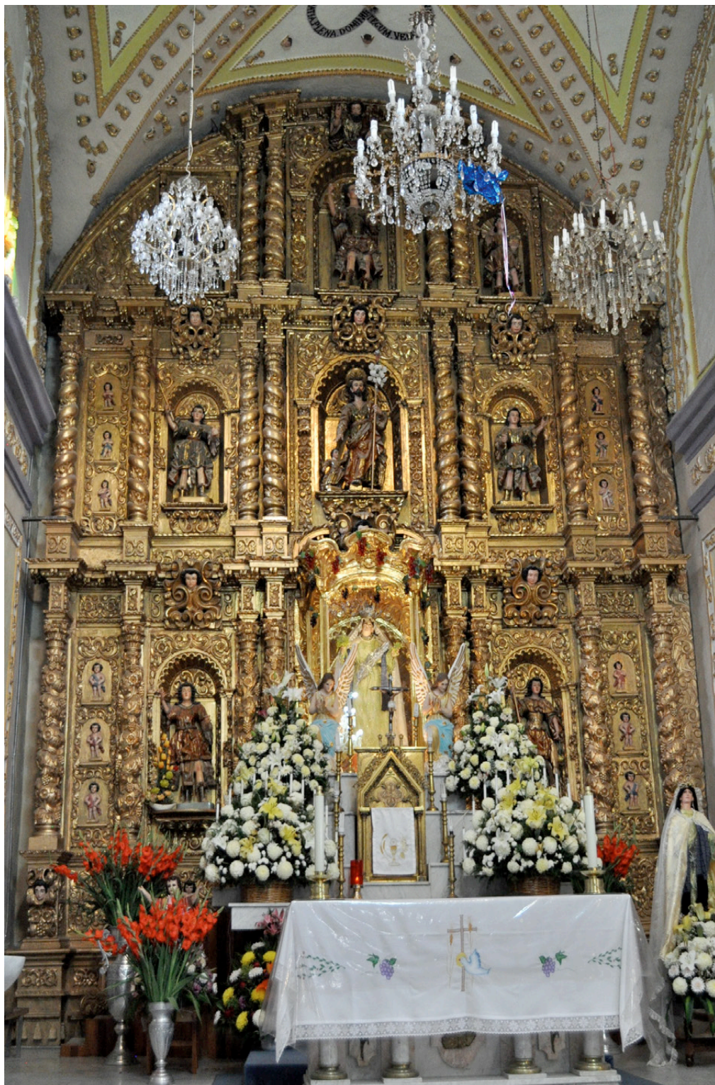
Figura 1. Retablo cubierto de oro bruñido. Iglesia de Santa María Acuexcomac, San Pedro Cholula, Puebla, México. Retablo mayor (Fotografía: Cordero, A. 2012). Altarpiece covered with burnished gold. Santa María Acuexcomac Church, San Pedro Cholula, Puebla, México. Main altarpiece. (Photograph: Cordero, A. 2012).