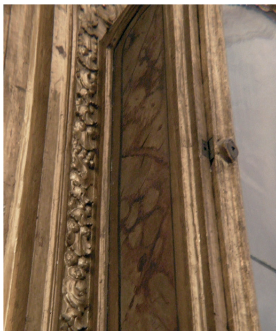
Figura 8. Imitación de las vetas de los mármoles mediante el jaspeado. Retablo lateral del templo de La Enseñanza, México, D.F. (Fotografía: Cordero, A. 2012). Imitation of marble veinings through speckles. Lateral altarpiece from La Enseñanza Temple. México, D.F. (Photograph: Cordero, A. 2012).