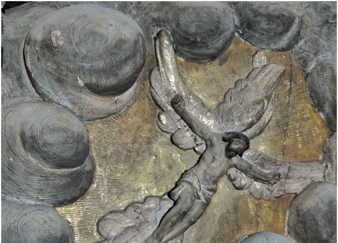
Figura 3. Detalle de estofado con la técnica de esgrafiado-rayado. Exconvento de Huejotzingo, Puebla, México. Retablo mayor.

Detail of estofado etching through paint. Former monastery of Huejotzingo, Puebla, México. Main altarpiece.