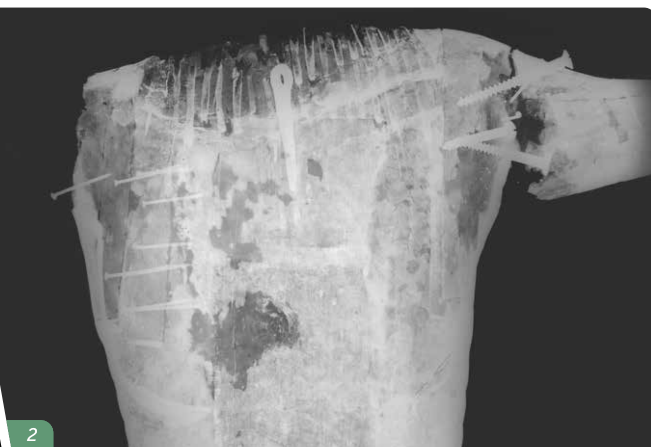
Imagen 1: Corte estratigráfico de la policromía de Cristo. Se observan los diferentes estratos de base de preparación y policromías de la escultura. Imagen 2: Radiografía del torso de Cristo. Se observan clavos, tornillos y otros elementos metálicos insertos en la madera.