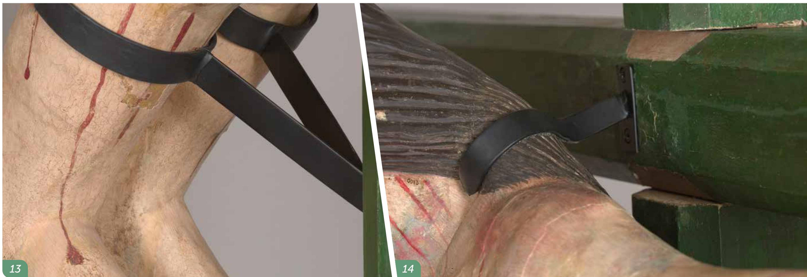
Imagen 3: Unión y adhesión de la cabeza al cuerpo de Cristo.