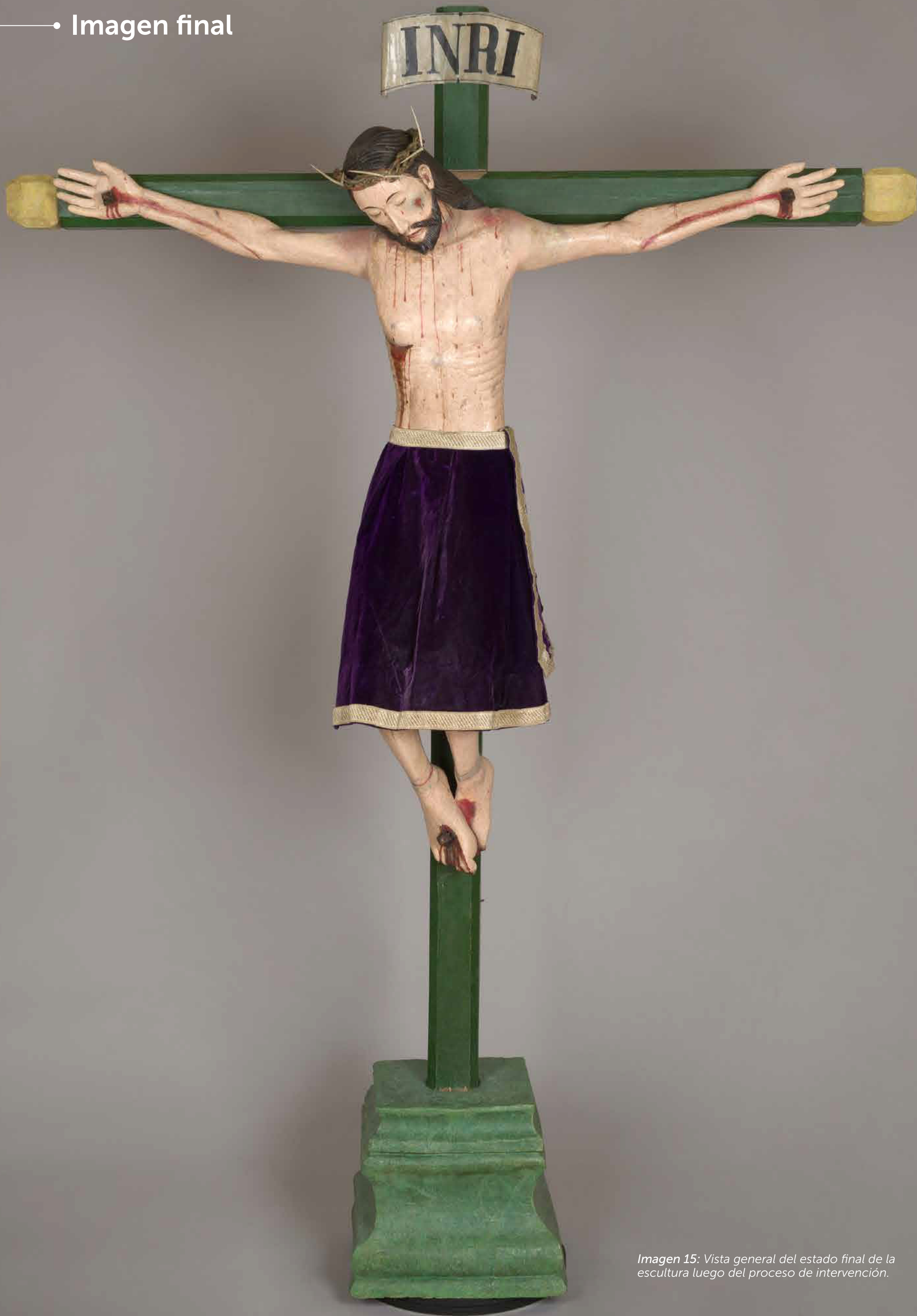
Imagen 15: Vista general del estado final de la escultura luego del proceso de intervención.

1 "El soporte se refiere al material o estructura física sobre la cual se encuentra la obra de arte o el objeto cultural que se está restaurando" (Muñoz Viñas, 2004).